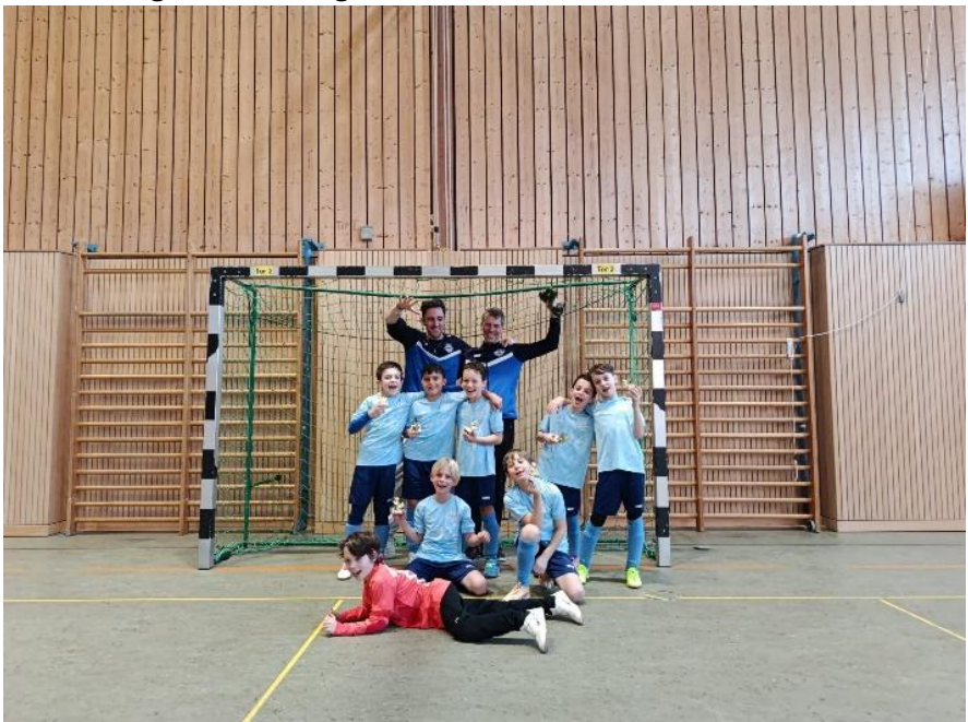
Turniersieg in Haspelmoor