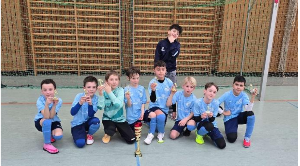
Turniersieg in Germering

Nach einer sehr erfolgreichen Hallensaison freuen wir uns nun auf die kommende Spielrunde im Frühjahr/Sommer, bevor alle Kinder der F1 zur nächsten Saison in die E-Jugend wechseln werden.